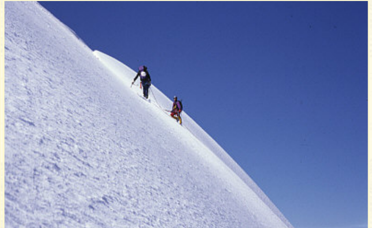
Ideale Verhältnisse am Galletgrat! Er gehört mit Recht zu den schönsten Gratüberschreitungen der Berner Alpen