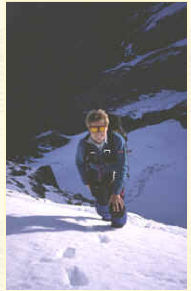
Tiefblick auf der Ostseite des Grates

Hier beginnt nun der Galletgrat. Wunderschön ist von hier aus der Blick in die Nordwand, die im ersten Morgenlicht nun auftaucht. Zunächst sorgt ein gemächlich ansteigender Firnhang für Beruhigung der Nerven, bis es dann steiler wird. Es wechseln nun Firn- mit Felspassagen. Meistens steigen wir rechts (westl.) des Grates hinauf, aber ab und zu wechseln wir auch auf die ausgesetztere Ostseite. Wegen der Eisglasur auf den dort recht brüchigen Felsen mußten wir höllisch aufpassen, keiner wechselte ein Wort, jeder konzentrierte sich voll auf jeden nächsten Schritt. Eine Sicherung war hier nicht möglich, weshalb wir alles seilfrei gingen. Die warme Morgensonne konnte ich erst so richtig genießen, als wieder Firn unter den Steigeisen knirschte und für etwas mehr Sicherheit sorgte.