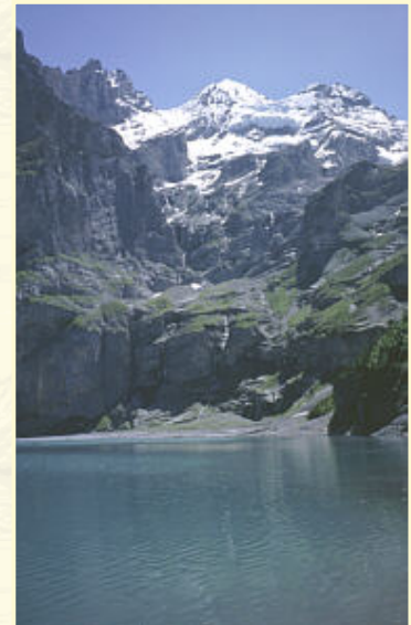
Der Öschinensee mit der Blümlisalpgruppe

Dem Rat des Hüttenwirtes folgend steuern wir eine von oben schlecht sichtbare Verschneidung an, die den besten Abstieg zum Gletscher bedeutet. Über leichte Felsen steigen wir diese hinab und sind wenig später auf dem Doldenhorngletscher.