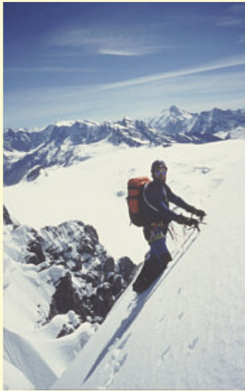
Der Blick zurück: Über meinem Kopf erkennt man das Aletschhorn