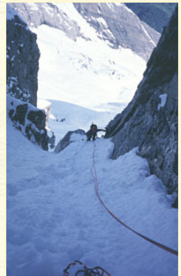
In der Rinne wühlen wir uns durch den tiefen Schnee. Bald ist die Firnschneide erreicht.

Ein paar Steilstufen sind nun mit Ketten und weiter oben mit dicken Tauern versichert. An diesen sehr steilen Felspassagen zieht der Rucksack gewaltig nach unten. Am Tau sichern wir uns mit einer Bandschlinge, die wir mittels Prusikknoten Seil befestigen. Irgendwie wird das schon halten, denke ich mir, ist aber wohl in diesem Fall die beste Sicherung. Man muß das Tau beherrscht anpacken und sich dann möglichst rasch ohne Pause hocharbeiten.