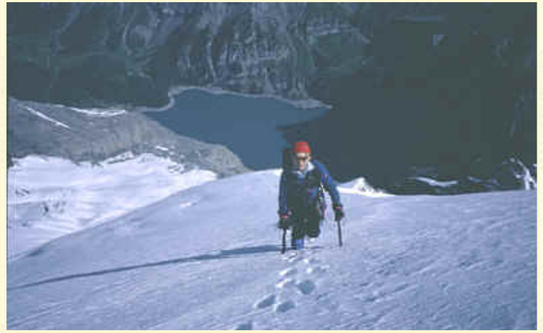
Tiefblick hinunter zum 2000 m tiefer gelegenen Öschinensee

Der nun folgende Gratabschnitt gehört sicher zu den ganz großen "Sahnestückchen" in den Berner Alpen. Im Rücken steht Eiger, Mönch und Jungfrau, vor einem der mit mehreren Aufschwüngen gespickte, scharfe Firngrat, der bis unter den Gipfelaufbau führt und unter uns immer der gewaltige Tiefblick zum 2000 m tiefer gelegenen Öschinensee hinunter. Ich hatte oft den Eindruck, mitten im See zu landen, sollte ich hier ins Rutschen kommen.