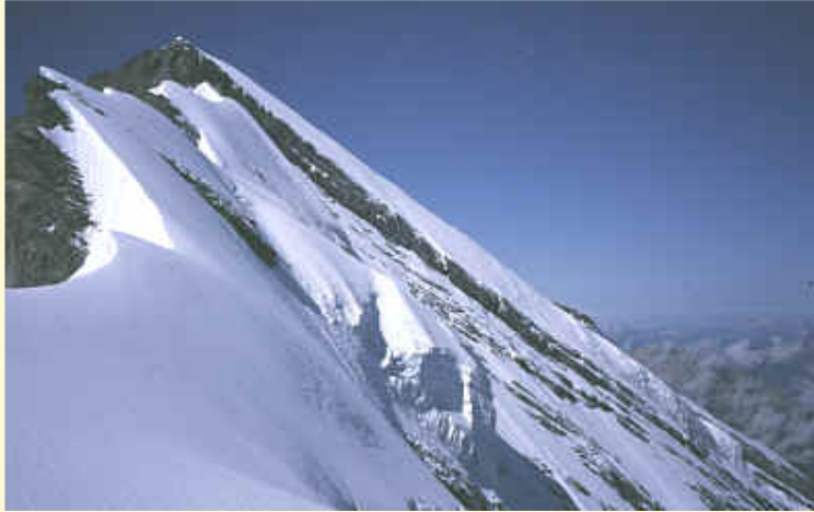
Blick über die Firnschneide hinüber zum felsigen Gipfelaufbau

Sie hat nun leider schon etwas den Grat an seinem Beginn aufgeweicht, was sehr unangenehm ist. Wie soll man hier sichern? Gar nicht, also verstaute wir das Seil wieder im Rucksack und stiegen weiter.