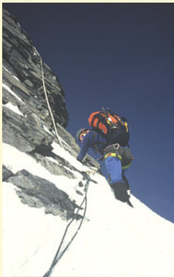
Taue erleichtern streckenweise den Aufstieg

Hier beginnt nun der Galletgrat. Wunderschön ist von hier aus der Blick in die Nordwand, die im ersten Morgenlicht nun auftaucht. Zunächst sorgt ein gemächlich ansteigender Firnhang für Beruhigung der Nerven, bis es dann steiler wird. Es wechseln nun Firn- mit Felspassagen. Meistens steigen wir rechts (westl.) des Grates hinauf, aber ab und zu wechseln wir auch auf die ausgesetztere Ostseite. Wegen der Eisglasur auf den dort recht brüchigen Felsen mußten wir höllisch aufpassen, keiner wechselte ein Wort, jeder konzentrierte sich voll auf jeden nächsten Schritt. Eine Sicherung war hier nicht möglich, weshalb wir alles seilfrei gingen. Die warme Morgensonne konnte ich erst so richtig genießen, als wieder Firn unter den Steigeisen knirschte und für etwas mehr Sicherheit sorgte.