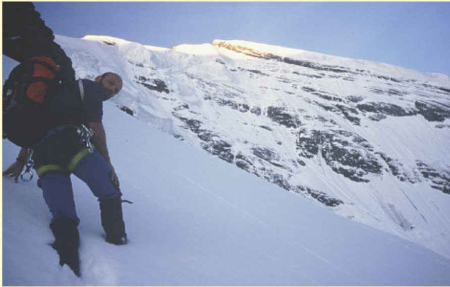
Blick vom ersten Teil des Grates in die Nordwand hinein.