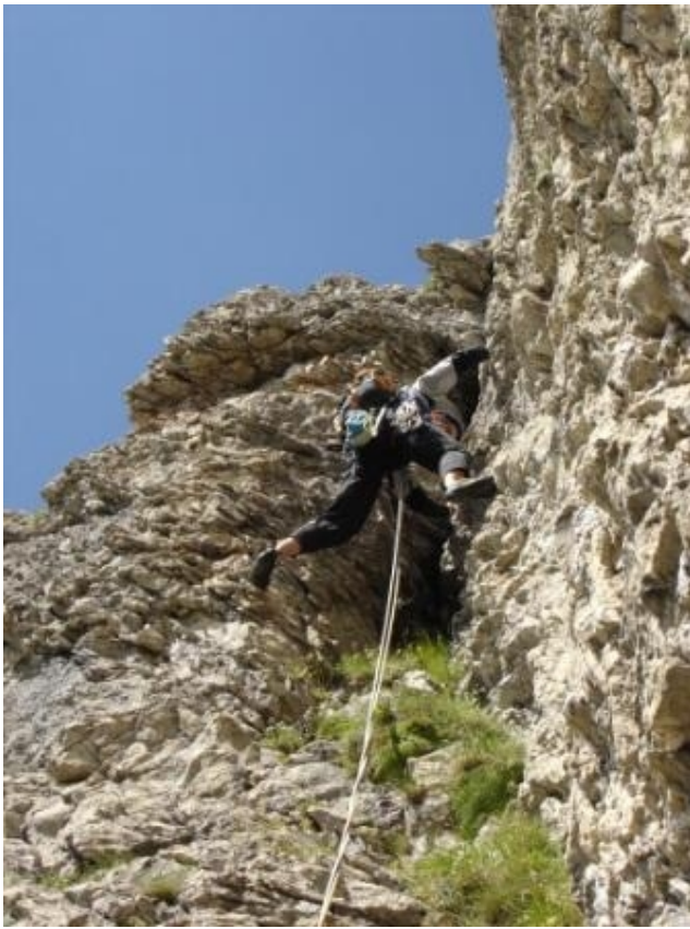
Rädlergrat links im Profil